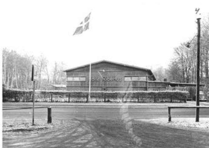
Ridehuset på Vangebovej