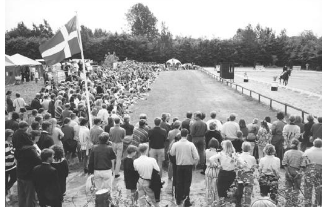
DM dressur 1995 – fulde huse på tilskuerpladserne