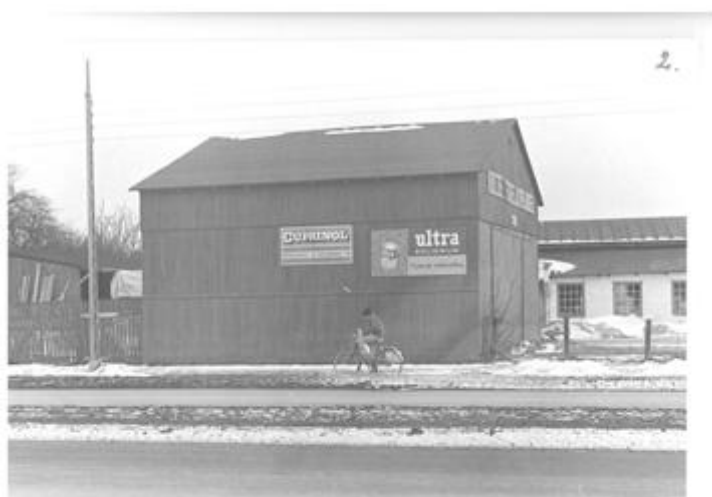
Det første ridehus